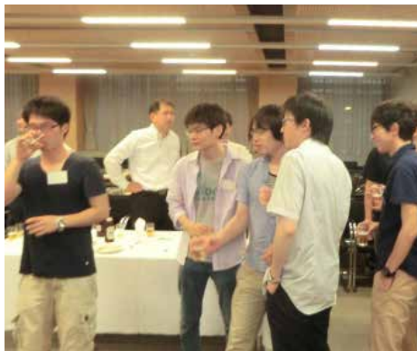
学生も大勢参加してくれました