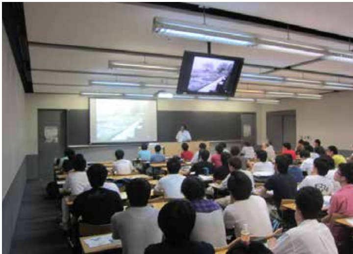
特別講演会の様子