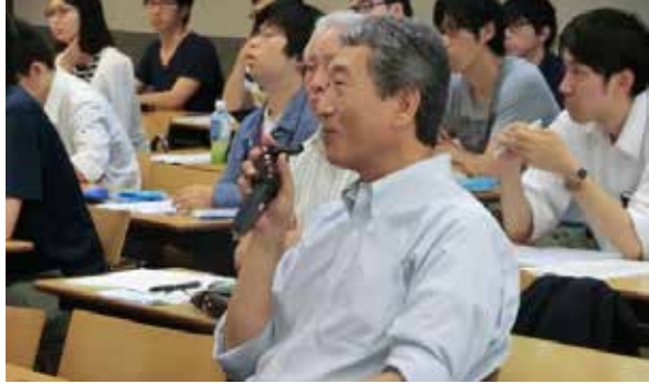
地盤の会・会場からの質疑の様子